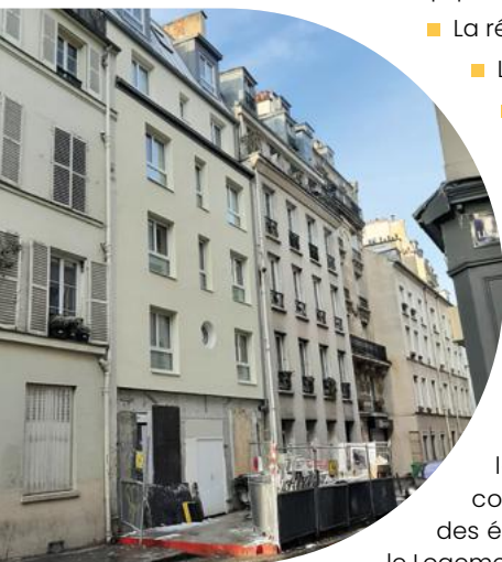
Exemple de chantier en cours

Les locataires de ces logements sont suivis par l'équipe de gestion locative de la Fondation ainsi que par différents types de partenariats et d'associations, comme Champ-Marie, Entre2Toits ou Un Toit Pour Tous, l'Association de gestion des établissements des Petits Frères des Pauvres (PFP-AGE) et les équipes « Action Vers le Logement » (AVL) de l'Association des Petits Frères des Pauvres.