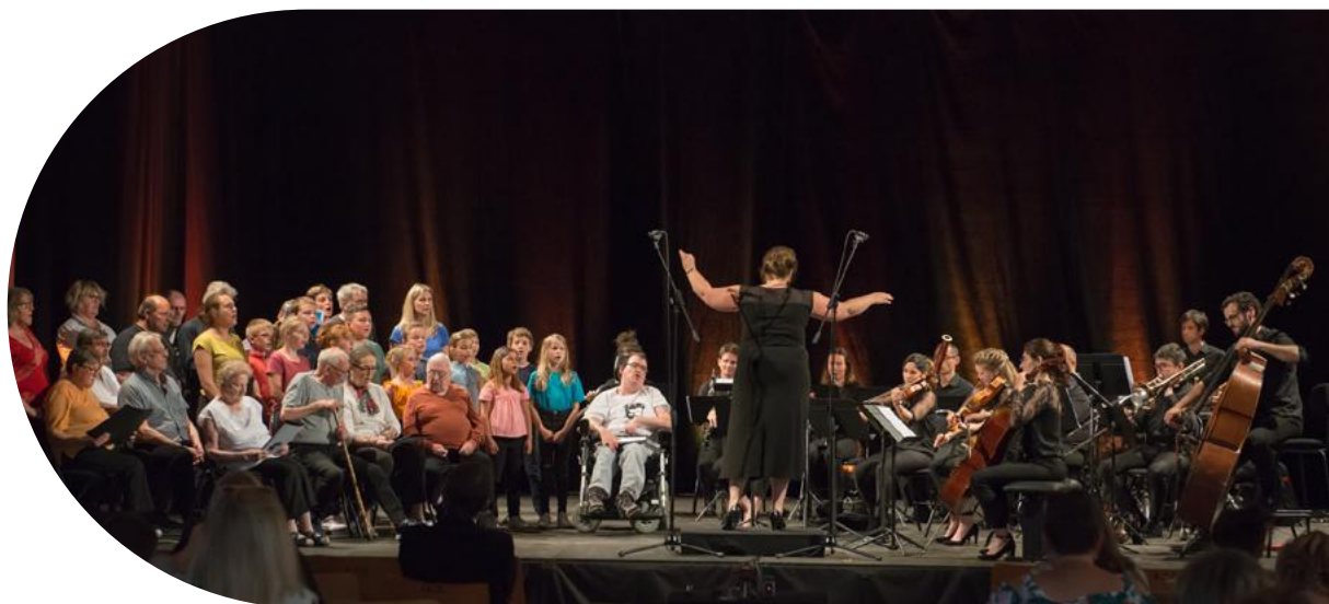
Les Concerts de Poche