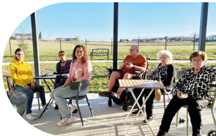
Maison Astrolabe

Inspirée de l'architecture de la Maison de Gardanne à Marseille et de son esprit de soins palliatifs, la Maison Astrolabe est avant tout un lieu de vie chaleureux et de répit pour des personnes en perte d'autonomie. Située à Cahuzac-sur-Vère (81), cette maison a reçu le soutien de la Fondation Andrée Morillon pour son fonctionnement et des frais d'investissement visant un meilleur confort de ses résidents.