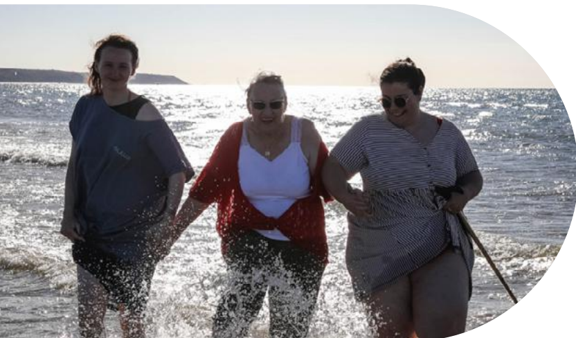
Séjour Maris Stella à Wissant, août 2022 - Equipe Lille Fives

L'Association Petits Frères des Pauvres recommande la création d'espaces conviviaux, l'ouverture de lieux collectifs aux aînés et la promotion d'habitats intergénérationnels, tout en plaidant contre la marchandisation du lien social et en appelant à une sensibilisation accrue contre l'âgisme. Ce rapport constitue un appel à l'action pour réduire l'isolement des aînés par le renforcement des liens intergénérationnels, offrant un éclairage précieux sur les défis et les solutions potentielles pour une société plus inclusive.