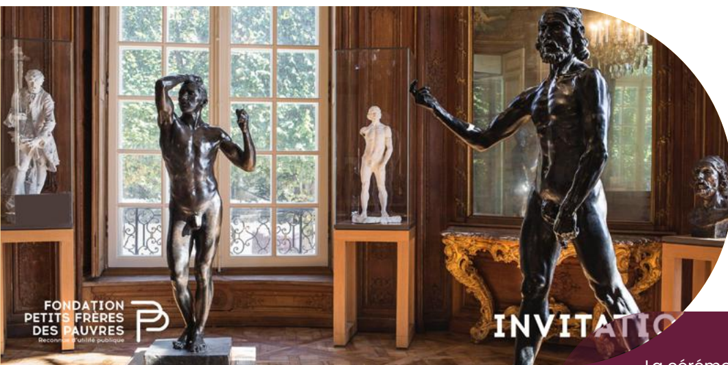
Carton d'invitation cérémonie remise de prix, juillet 2023

La cérémonie de présentation des lauréats et de remise des prix s'est déroulée au musée Rodin le jeudi 6 juillet 2023.