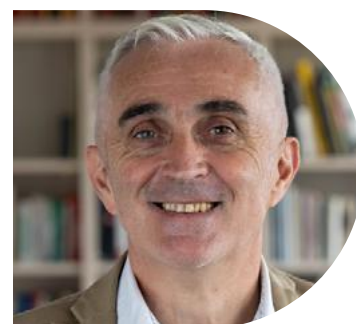
Par Gaël Brenaut, Président