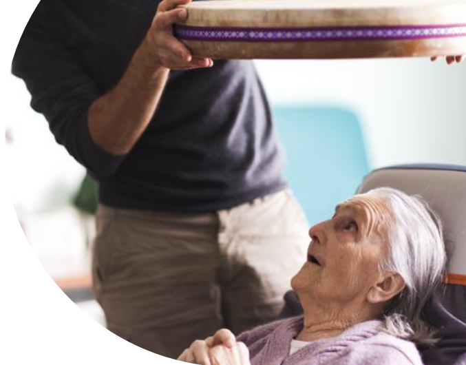
Fondation Artistes à l'Hôpital - ©Vincent Arbelet