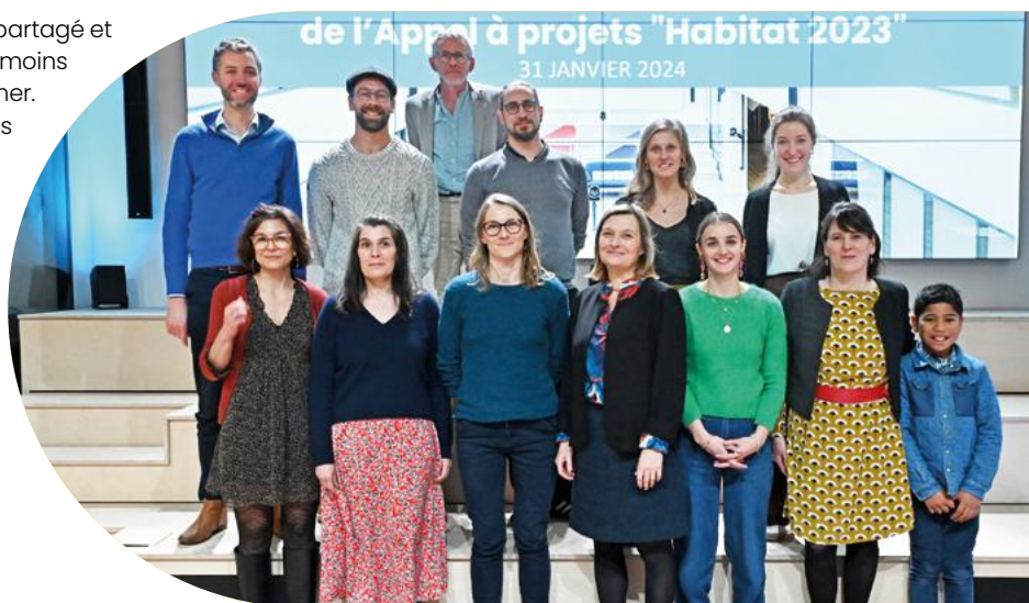
Lauréats de l'appel à projets Habitat 2023

Basée dans l'Orne, l'Association Vertoit rénove et aménage une ancienne maison de ferme pour mettre en œuvre un projet d'habitat partagé, comprenant des espaces communs intérieurs et extérieurs. Trois studios, adaptés aux personnes à mobilité réduite, loués à des loyers modérés seront créés. Soucieuse de l'environnement, l'Association privilégie l'utilisation de matériaux écoresponsables et le savoir-faire traditionnel et a pour objectif de participer à la réimplantation d'une vie intergénérationnelle dans nos campagnes.