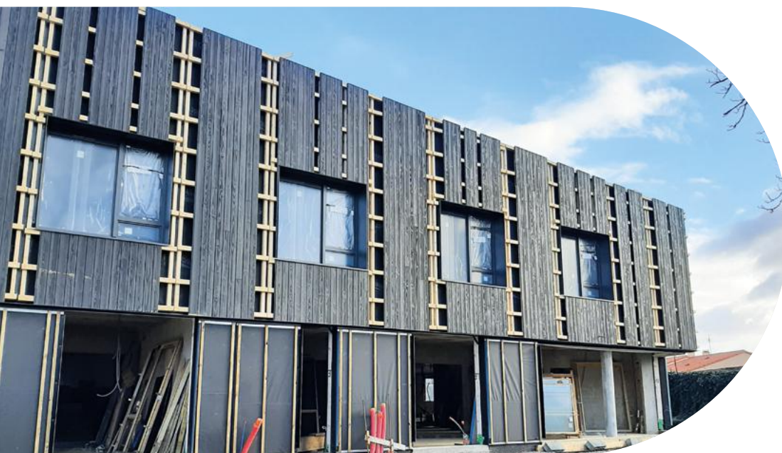
Pension de famille à Vertou

Cf. Site des Bricos du cœur Chantier Solidaire : logement à Lille rue de Marseille.