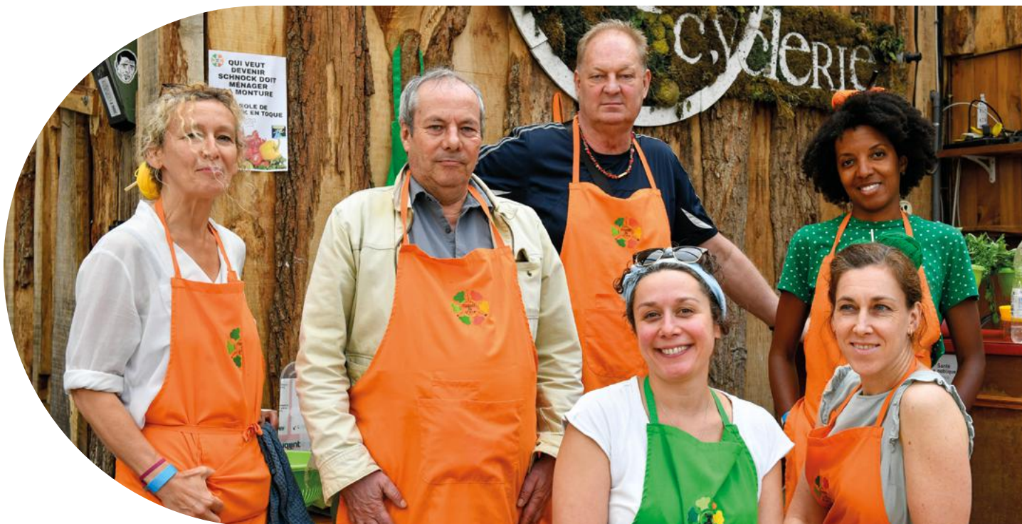
Toques en stock

Située à proximité de Rennes, cette association œuvre pour le mieux-être des personnes en collectant des produits d'hygiène qu'elle redistribue ensuite aux personnes ayant de faibles ressources, en particulier aux personnes âgées en situation de précarité. La Fondation accompagne Bulles Solidaires dans différents aspects de cette action, tels que l'achat de fournitures et l'aménagement du local de collecte, etc.