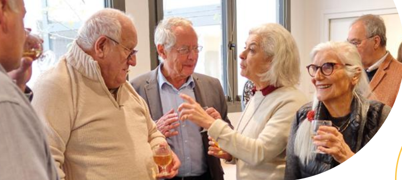
Séminaire de fin d'année - © Daniel Schwab