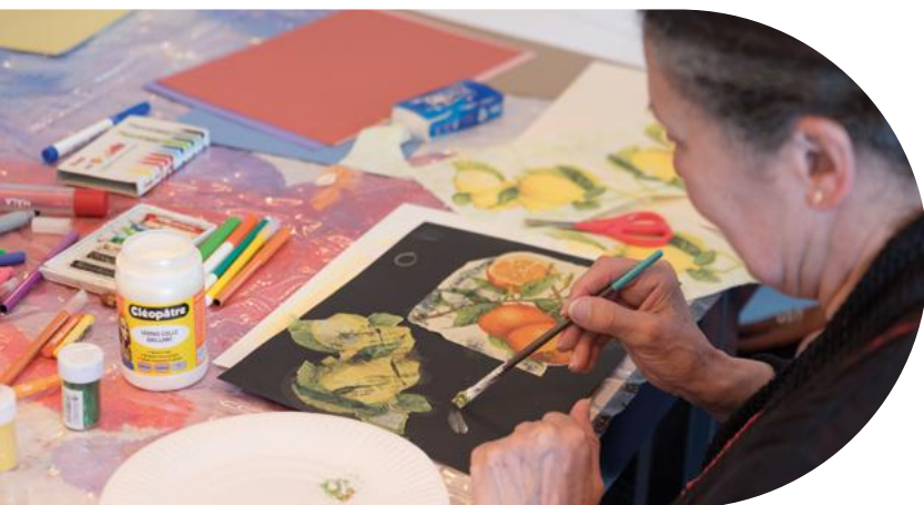
Fondation UTB - ©H Elbaum

Les fondations abritées ont soutenu 55 actions pour un montant total de 955 217 €, dont 42 % en faveur des Petits Frères des Pauvres et 58 % en faveur d'autres associations.