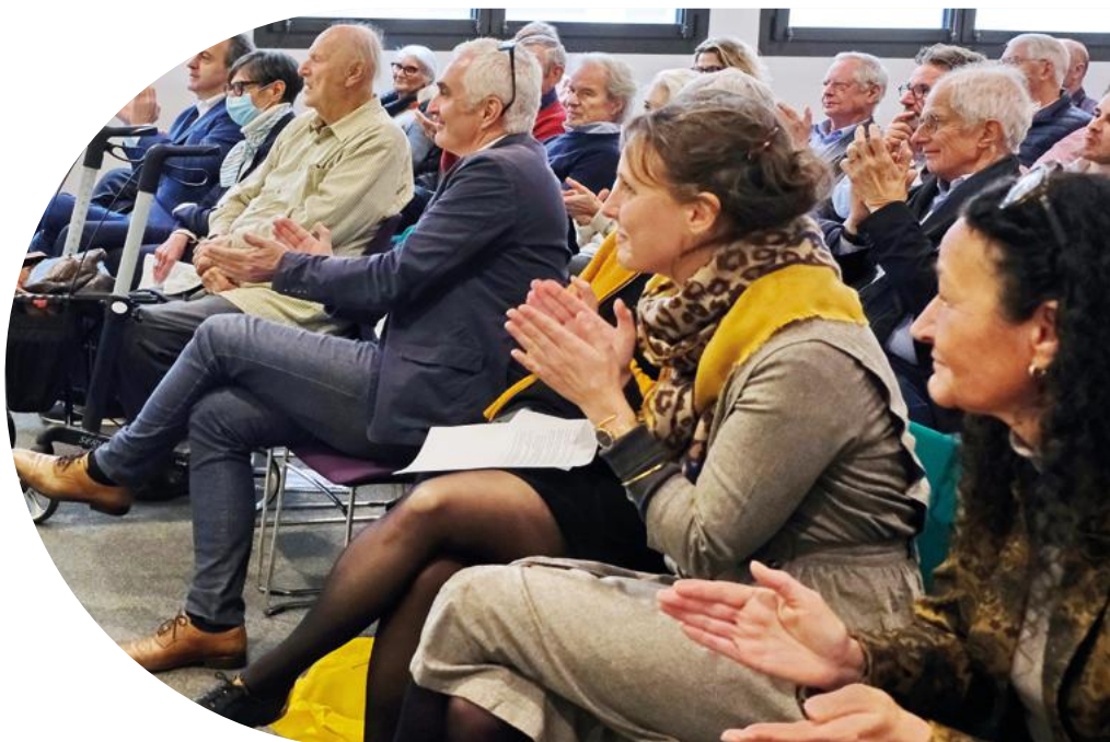
Séminaire de fin d'année - © Daniel Schwab