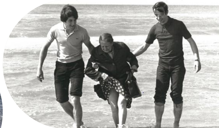
Séjour vacances Petits Frères des Pauvres en 1970