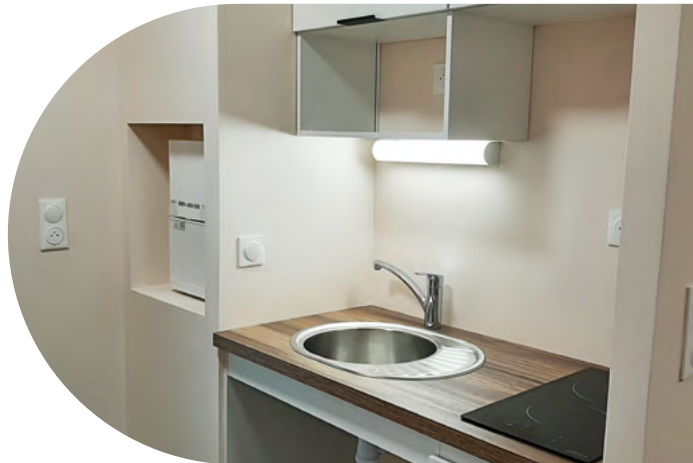
Exemple de logement

Au cours de l'exercice 2023, 45 attributions ont été réalisées, contre 25 en 2022, grâce à la mise en service de 19 nouveaux logements (16 au sein de la petite unité de vie Gautier-Wendelen située dans le 19 e arrondissement de Paris et 3 au sein de la Maison de Charmanon à Grézieu-la-Varenne) lors de 7 commissions logement.