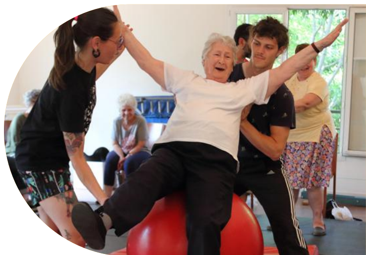
Académie Fratellini

Pendant une durée de trois ans, l'Académie Fratellini va renforcer son engagement envers les seniors en EHPAD ou résidences autonomie en leur faisant découvrir le cirque contemporain et les artistes en devenir. Des moments réguliers d'échanges et d'activités - des ateliers de cirque, des rencontres et des spectacles - seront organisés pour encourager l'autonomie, la confiance en soi, l'ouverture artistique et le bien-être des participants pour rompre leur routine et l'isolement.