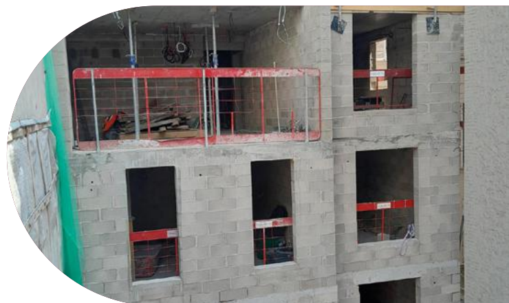
Pension de famille, Rivages (Paris 17)

Ce projet parisien ouvrira ses portes en avril 2024. Cette pension de famille est soutenue par l'État, la ville de Paris et la région Ile-de-France est possible grâce au soutien des donateurs de la Fondation.