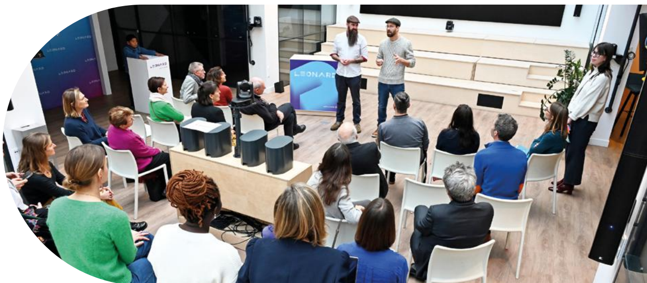
Cérémonie remise des prix appel à projets Habitat 2023 chez Léonard : Paris

L'association Loki Ora a pour objectif d'accompagner des colocations durables et sereines en favorisant le libre choix et la responsabilité des personnes. Ces colocations s'adressent à des seniors qui souhaitent vivre ensemble et en toute autonomie. 4 colocations de 4 personnes chacune ont déjà vu le jour sur la région nantaise.