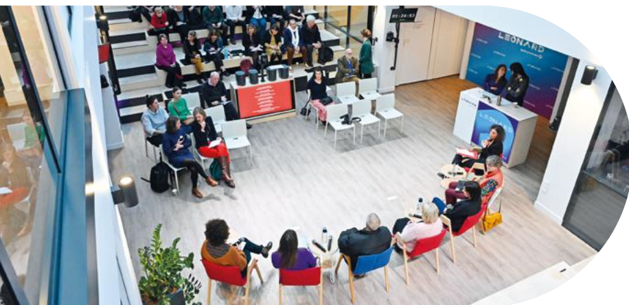
Cérémonie remise des prix appel à projets Habitat 2023 chez Léonard, Paris