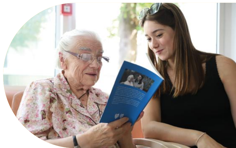
Chaque Histoire Compte Vraiment

L'« Opérabus » créé par l'ensemble baroque Harmonia Sacra de Valenciennes apporte une réponse concrète aux problématiques de démocratisation culturelle et d'inclusion sociale par la culture. Pour favoriser le lien social et intergénérationnel, l'Opérabus donnera 72 représentations lors d'une tournée de 18 jours à la rencontre des résidents des EHPAD et foyers de la région Hauts-de-France. Un projet ouvert aux familles, aux personnels soignants ainsi qu'aux habitants.